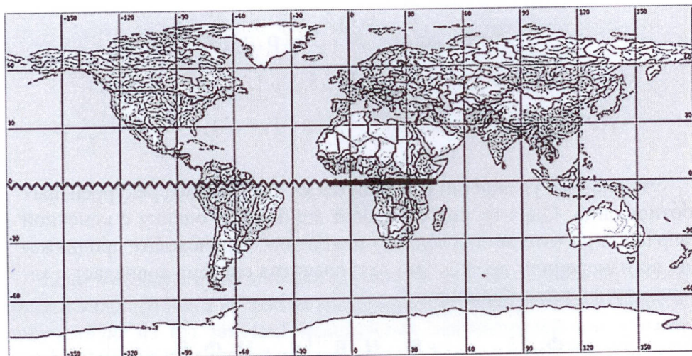
Рис. 1. Трасса орбиты КА Express 3А